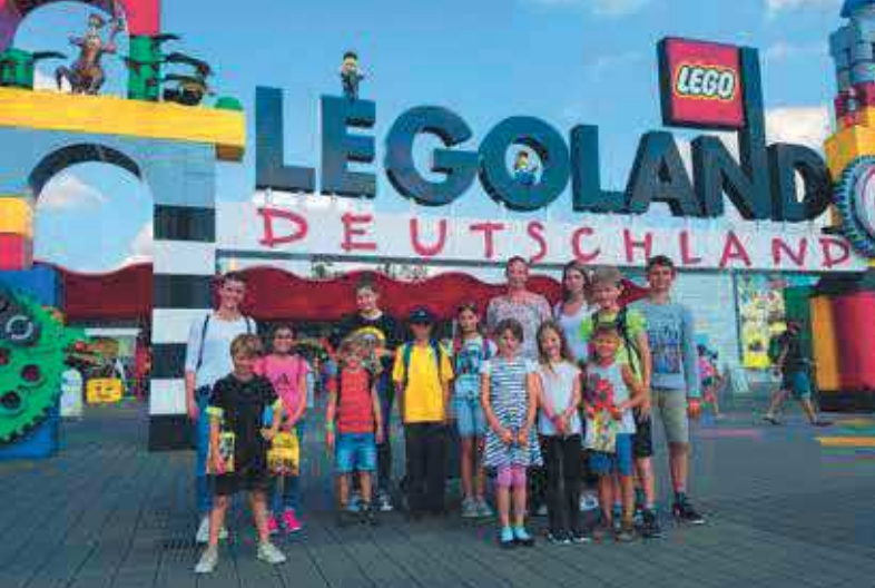
Einen Ausflug ins LEGOLAND ermöglichte die Dennis-Kayser-Stiftung