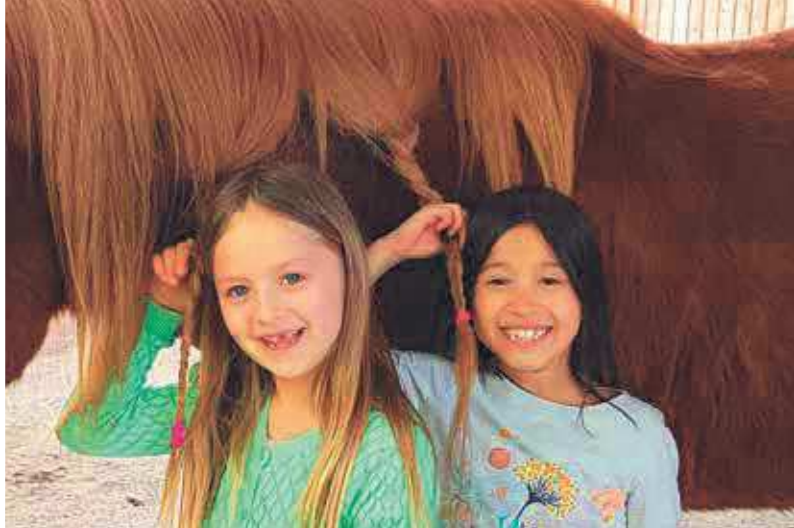
Spaß mit Pferden auf dem Island-Pferdehof